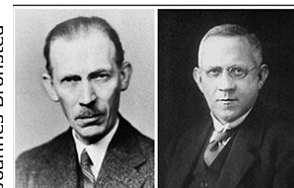
Thomas Martin Lowry